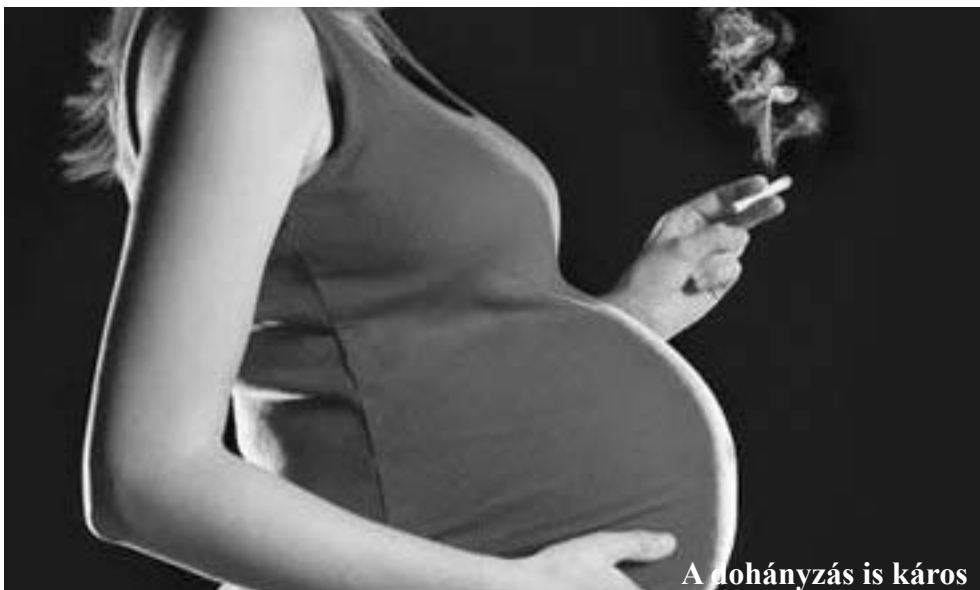
A dohányzás is káros

Ajánlatos a zöldségben, a gyümölcsben, a növényi rostokban bő táplálkozás. Kerülendők a zsíros ételek, amelyek a terhesség alatti cukoranyagcserét is negatívan befolyásolják. Kerülendő továbbá a