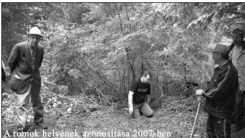
A romok helyének azonosítása 2007-ben