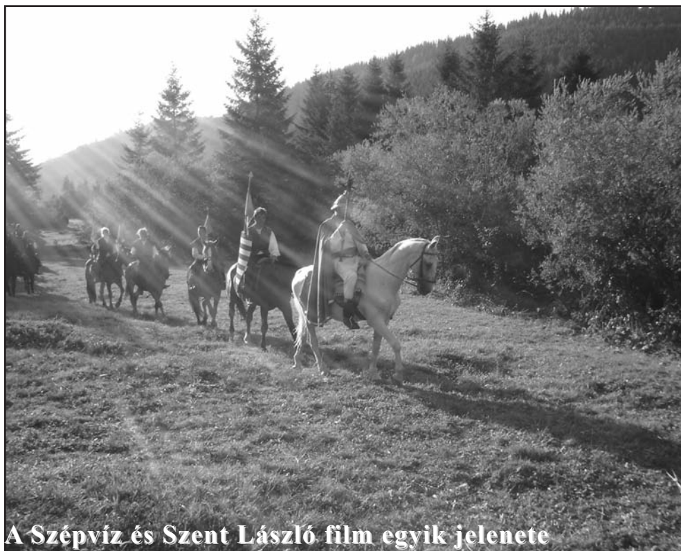
A Szépvíz és Szent László film egyik jelenete