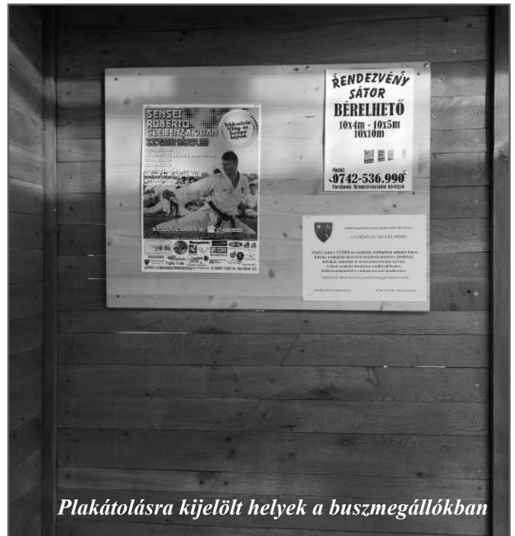
Plakátolásra kijelölt helyek a buszmegállóban

Biztosan sokakkal előfordult már, hogy szerettek volna valamit eladni, meghirdetni egy szolgáltatást vagy éppen elveszett állatot kerestek. Ilyenkor sok-sok lehetőséget, hirdetési felületet felhasználunk, és magunk is készítünk „plakátot”. Hónunk alá csapva frissen készített remekművünket elindulunk, hogy kihelyezzük a ragaszokat. Na, de hová? - Nem ragasztgathatunk bármit, bárhová, ez is le van szabályozva. Nem helyezhetünk hirdetőtáblát, reklámtáblát, molinót fára, például. Tilos hirdetményt, falragaszt a nem hirdetést szolgáló köztéri berendezéseken elhelyezni. Műemléken, védett épületen reklám elhelye-