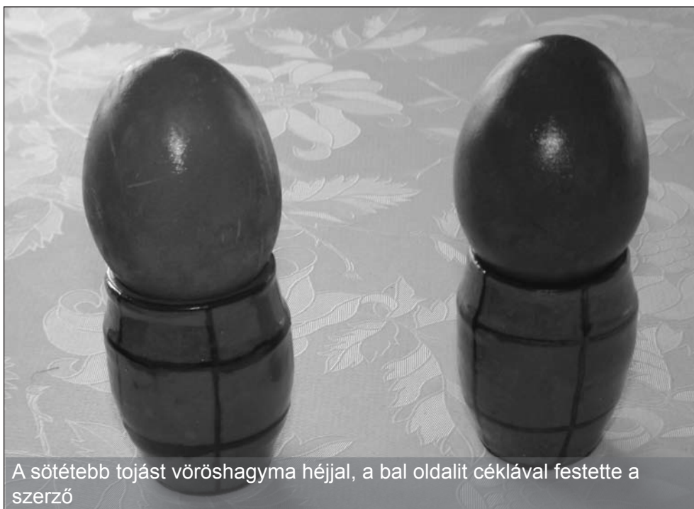
A sötétebb tojást vöröshagyma héjjal, a bal oldali céklával festette a szerző

Aki színes húsvéti tojásokat szeretne készíteni, annak célszerű az előző év folyamán előre begyűjteni és megszáritani a növényeket. Pirosas színt kapunk, ha vöröshagyma héjjal, céklahéjjal, áfonyával festjük a tojást, narancssárga színű lesz, ha fehér hagymahéjat vagy dióhéjat használunk. Sárga színt fest a körömvirág